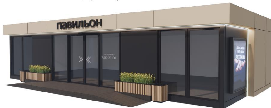
Видовые точки павильона в г. Лобня

габаритные размеры: 10,6м x 5,5м x 3,3м (высота) площадь торгового зала 50 м 2