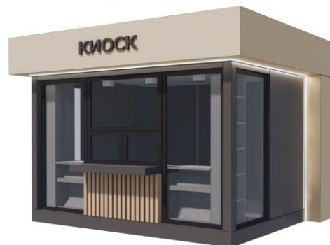
Видовые точки киоска в г. Лобня

габаритные размеры: 3,3м x 2,8м x 3м (высота) площадь торговая 6,3 м 2