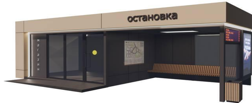
Видовые точки остановки в г. Лобня

габаритные размеры: 8,4м x 3,4м x 3м (высота) размеры внешние торговой точки: 4,7м x 3,4 м, S 13 м 2